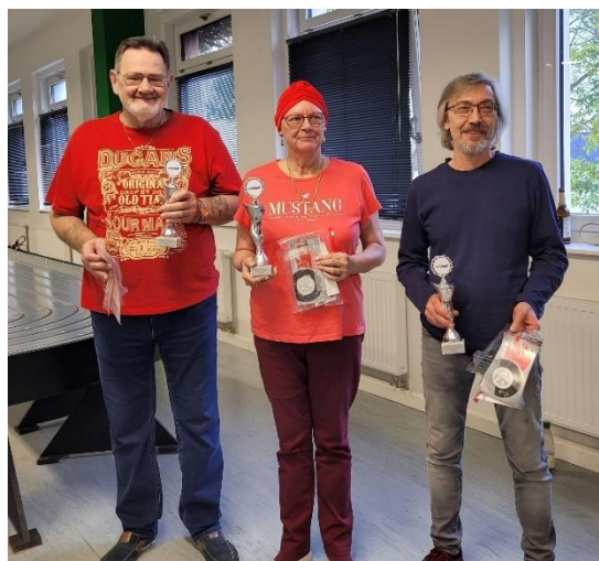
Seniorenwertung NOC 2022