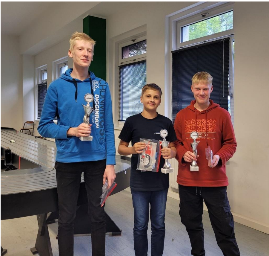
Juniorenwertung NOC 2022