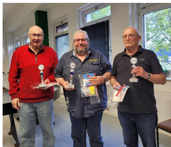
Superliga Wertung NOC 2022